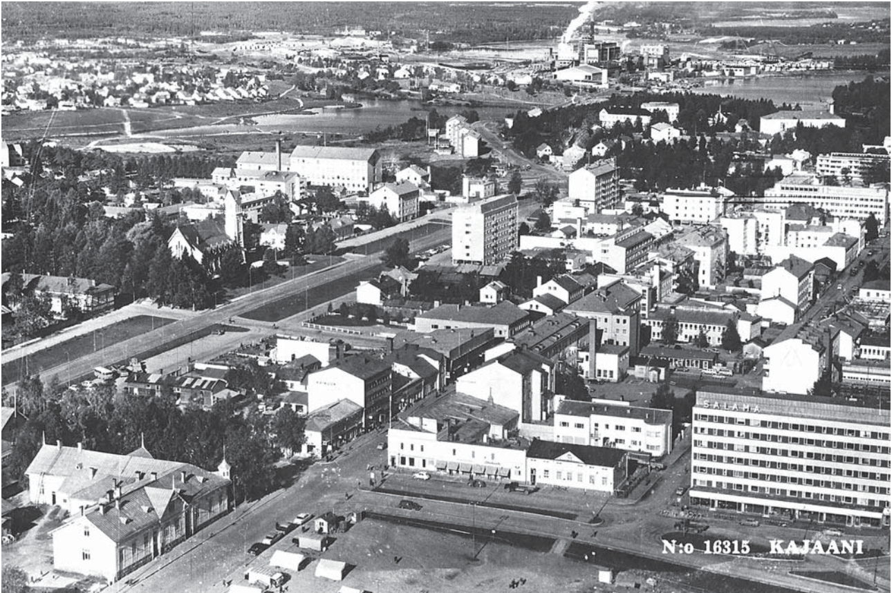
Kajaanin keskustaa 1960-luvulla, Veljekset Karhumäki postikortti. Kainuun Museon kuva-arkisto