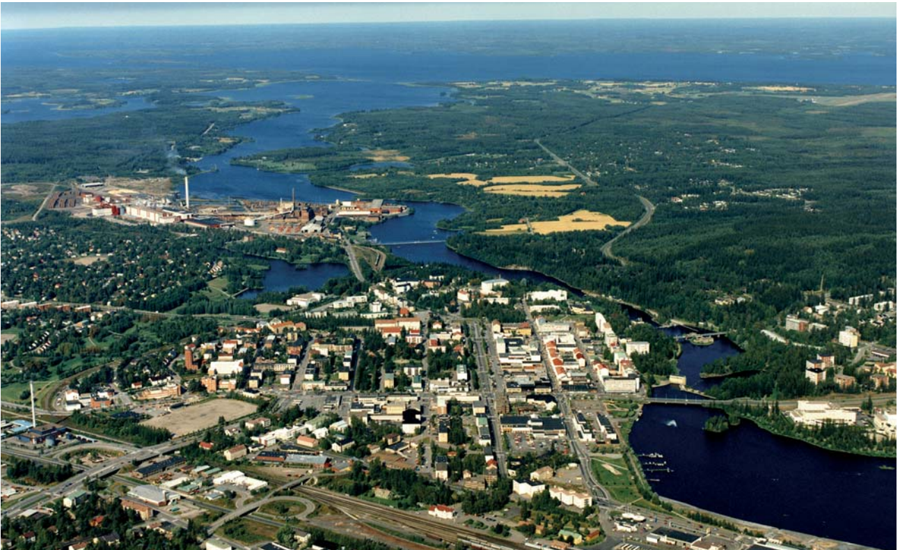
Kajaanin joki ja keskustaa.