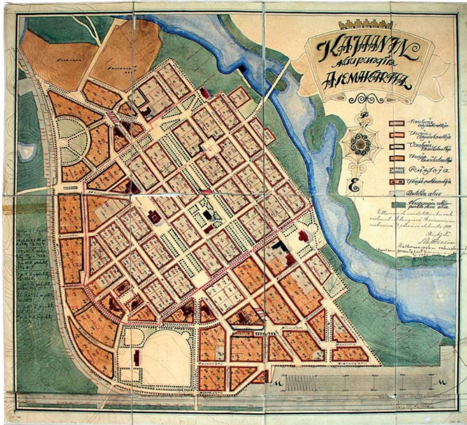
Kajaanin kaupungin asemakaava 1918-19 Harald Andersin