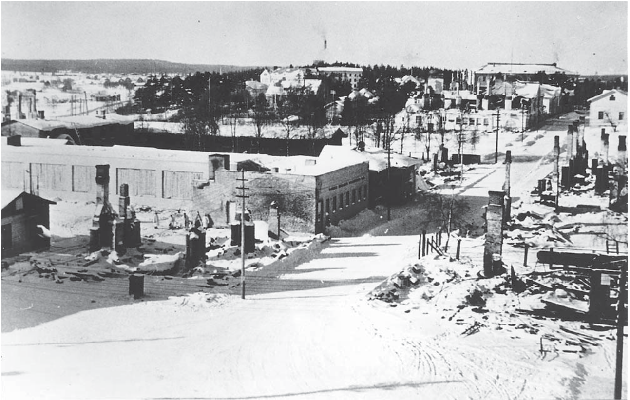
Kajaani, Kauppatua helmikuussa 1940