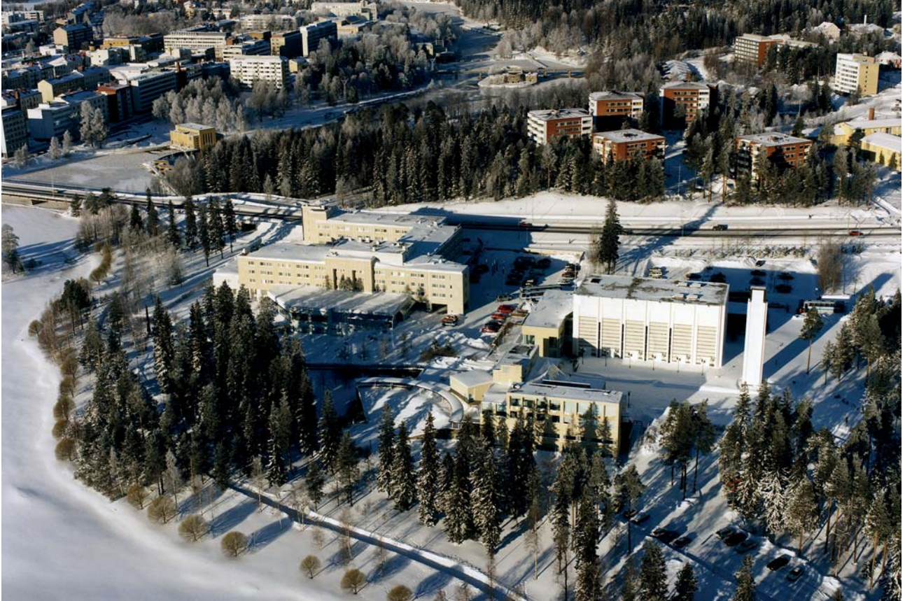
Kaukametsän alue