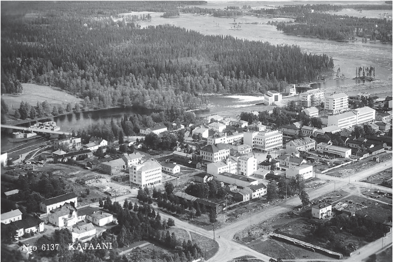
Kajaanin keskustaa, Veljekset Karhumäki postikortti. Kainuun Museon kuva-arkisto