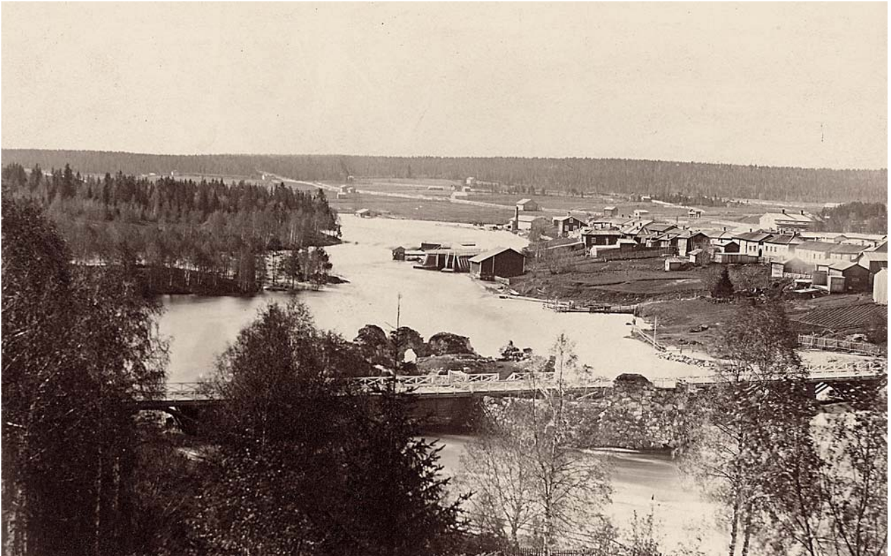
Kajaanin linnanrauniot, joki ja keskustaa, Herman Renfors. Kainuun Museon kuva-arkisto