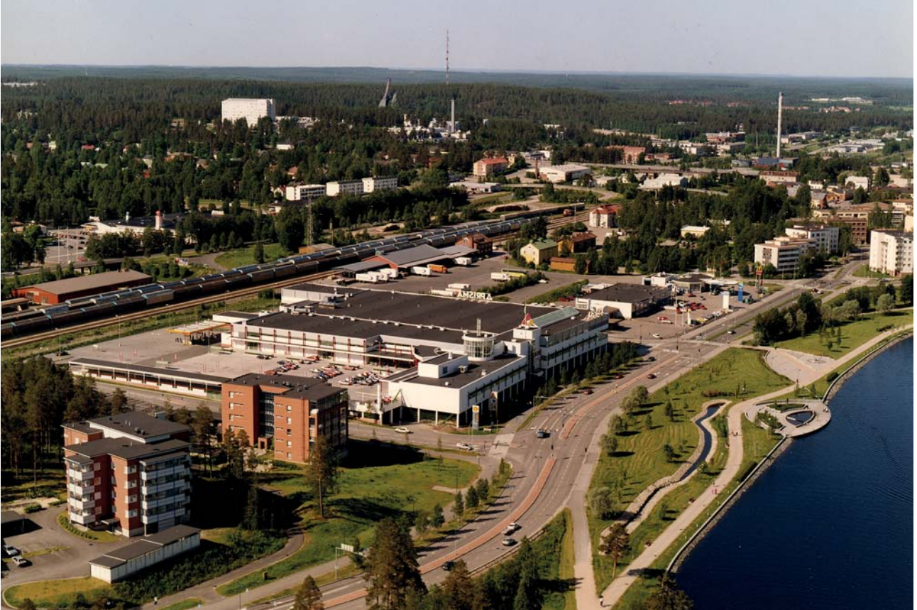
Suvantopuisto ja Prisman alue

Keskustan liiketilojen autoituminen käynnisti Raatihuoneentorin ja kävelyalueen rakentamisen, tunnelivoimalan massat käytettiin hyväksi Suvantopuistossa ja leirintäalueesta tuli asuntomessualue Onnela. Linnaprojekti museoviraston kanssa 2001-2008 jatkui 2015 valmistuneena Ranta- ja Kynäspuistojen kunnostuksena ja niiden välisenä Kynski-siltana.