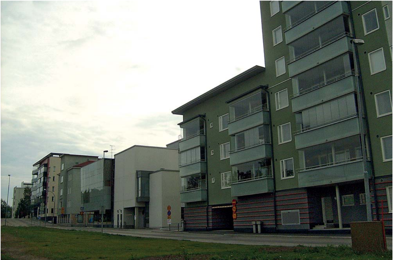
Ämmäkoskenkadun täydennysrakentamista.