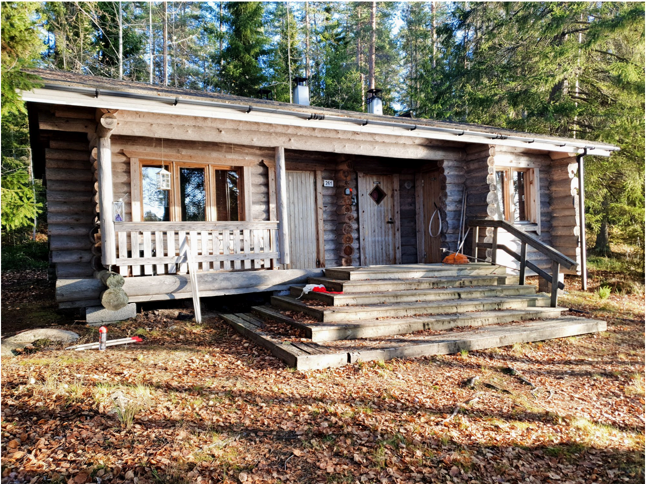
Läntinen alue ”puolukkarinne”