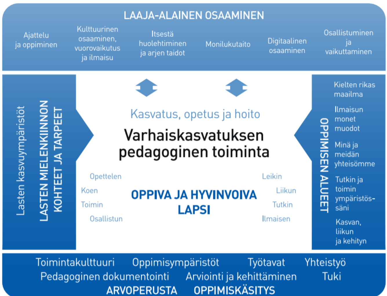
Kuvio 1. Varhaiskasvatuksen pedagogisen toiminnan viitekehys

Varhaiskasvatuksen pedagogista toimintaa ja sen toteuttamista kuvaa kokonaisvaltaisuus. Tavoitteena on edistää lasten oppimista ja hyvinvointia sekä laaja-alaista osaamista (kuvio 1). Pedagoginen toiminta toteutuu lasten ja henkilöstön välisessä vuorovaikutuksessa ja yhteisessä toiminnassa. Lasten omaehtoinen, henkilöstön ja lasten yhdessäideoima sekä henkilöstön suunnittelema toiminta täydentävät toisiaan. Varhaiskasvatuksen pedagoginen toiminta läpäisee kasvatuksen, opetuksen ja hoidon kokonaisuuden.