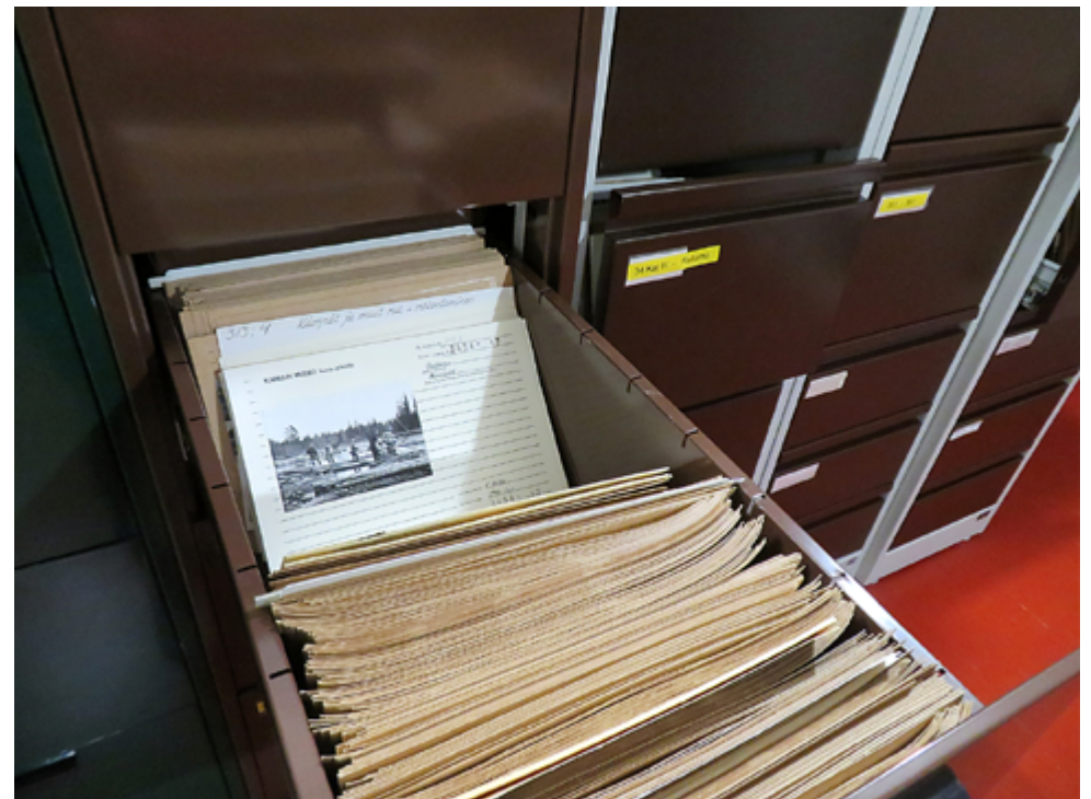
Valokuvakorttien säilytyksessä käytetään muun muassa metallisia arkistolaatikostoja, jotka alkavat olla jo täynnä.

Valokuvia on 1970-luvun lopulta 2000-luvulle asti kiinnitetty kuivaliimalla happovapaisiin kuvakortteihin. Viime vuosina kuvia ei enää ole liimattu, vaan ne säilytetään pergamiinipusseissa tai kirjekuorissa digitoinnin jälkeen. Ongelmana on, että kuvakorttien metalliset säilytyslaatikot ovat liian täynnä. Negatiiveja ja dioja on säilytetty negatiivi- ja diataskuissa. Kokonaiset kuva-albumit on säilytetty happovapaissa laatikoissa. Joissakin valokuvissa on havaittu tuhoutumiseen johtavaa prosessoitumista, mikä johtuu ennen kaikkea valokuvien valmistusprosessista.