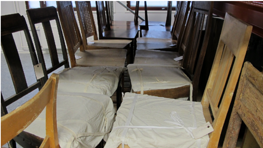
Museokokoelmien suojaamista esimerkiksi asianmukaisilla laatikoilla ja suojakankailla on jatkossa pyrittävä lisäämään.

Kokoelmaobjekteja on osittain suojattu arkistokelpoisilla laatikoilla ja koteloilla sekä silkkipapereilla ja puuvillakankailla. Erityisesti tekstiilivaraston osalta esineet on pakattu pääosin asianmukaisesti, mutta kovien esineiden osalta esineiden pakkaamista asianmukaisiin laatikoihin on lisättävä. Lisäksi esimerkiksi isompia esineitä on pyrittävä suojaamaan kankailla.