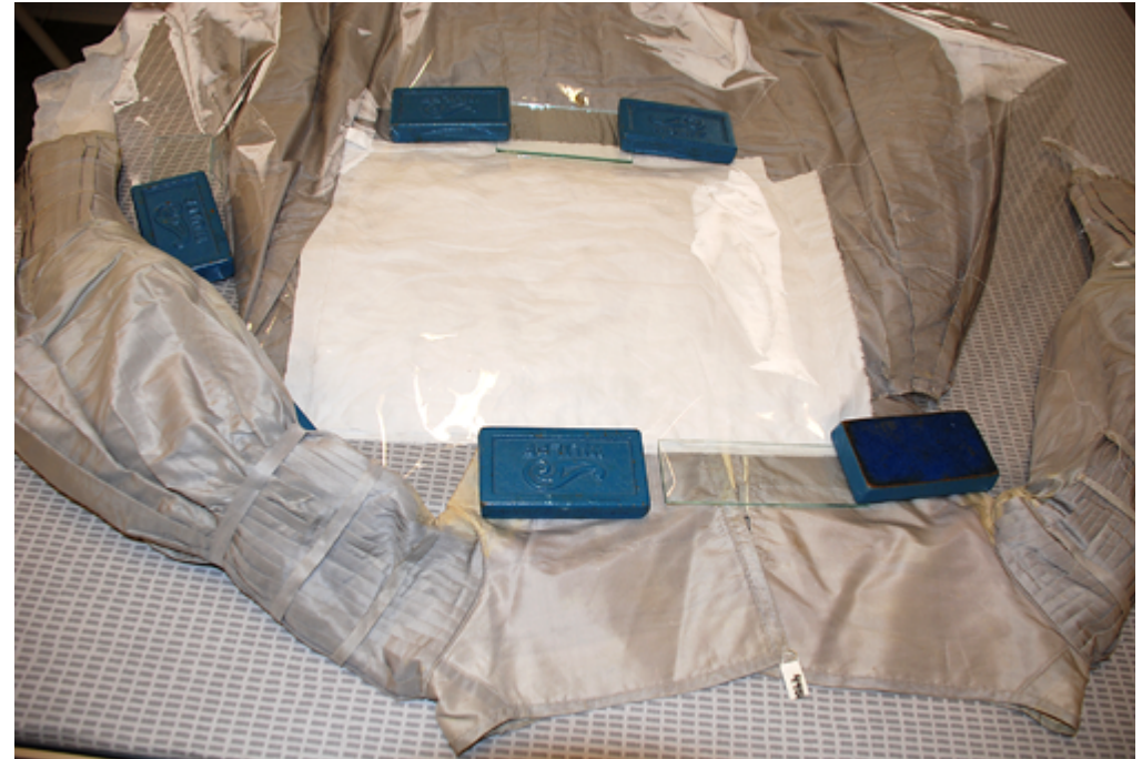
1870-luvulta peräisin olevaa pukua konservoidaan vuonna 2008. Muun muassa puvun helmaosan yläreuna suoritettiin vanhoista laskostaitoksista kosteushauteen ja painojen avulla.

Kokoelmiin tulevat esineet on puhdistettava. Koska Kainuun Museossa ei ole esinekonservaattoria, kovie esineiden osalta