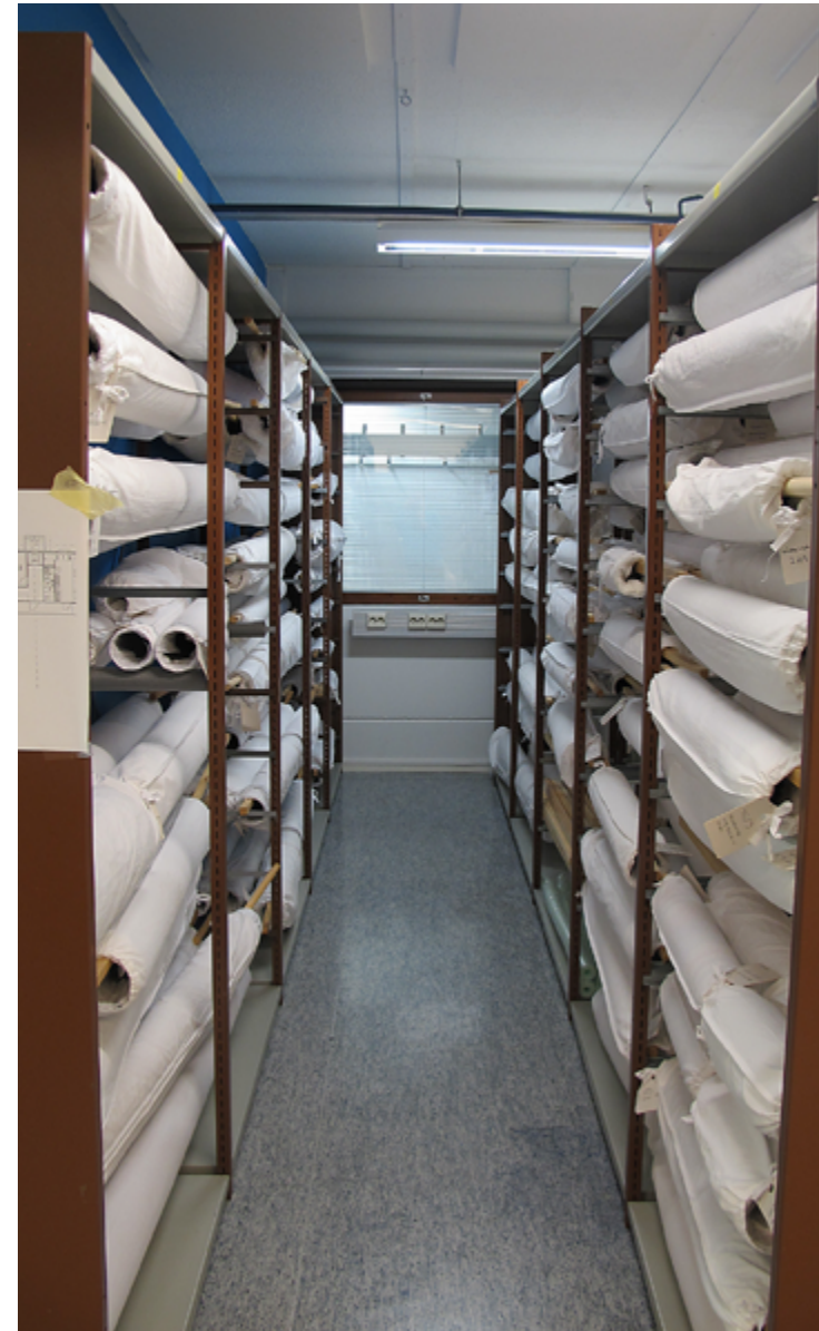
Osa tekstiilikokoelmista säilytetään rullattuina ja puuvillakankaalla suojattuina.

Säilytystilojen olosuhdeseurannasta vastaa pääasiassa museomestari ja tekstiilikonservaattori tekstiilien säilytystilan osalta. Kuitenkin jokainen museon henkilökunnasta on velvollinen