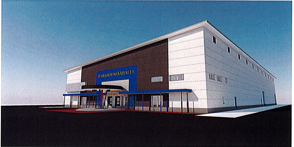
(Harjoitusjäähalli, havainnekuva arkkitehti Simo Karjalainen)

Talonrakennusinvestoinneissa sitovana tavoitteena oli 18 000 000 euroa ja toteutuma oli noin 17 360 000 euroa. Määrärahasäästö on syntynyt pääasiassa usean vuoden kestäväen Lyseon hankkeen jaksotuksen poikkeamista talousarvioon nähden. Uusi harjoitusjäähalli ja Kätönlahden koulun liikuntasali on uusina kohteina otettu käyttöön arviointivuoden aikana.